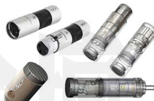
●原廠提供的優化器內部圖，可以見到內中複雜的做工，包括電容等小零件的選用，整體就是精密到最高點！

這次實戰所使用的系統為Pioneer VSX-LX805環繞擴大機搭配Canton Townus Highlight喇叭，由於VSX-LX805環繞擴大機上面端子非常多，所以這裡三款NCF Clear Line RCA/XLR線路優化器我就可以通通一件一件加於其上來體驗。首先我先加上了RCA的端子，加了一組後，我可以感受到聲音在聚焦、樂器與人聲形體就有顯著進化，邊緣線條強化很多，但不會銳利，而是一種3D