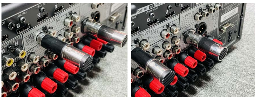
●這是兩款優化器插於Pioneer環擴背版上的使用實況。

類型：RCA、XLR線路優化器，使用材質：不感磁不銹鋼、NCF (Nano Crystal 2 Formula) 奈米結晶配方、碳纖維粒子、尼龍等複合材質，端子插頭： \alpha (Alpha) OCC鍍銀RCA、XLR公母插頭，參考售價：RCA8,300元、XLR公/母各11,500元，進口總代理：仲敏 (02-22783931)。