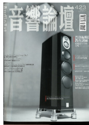
▶▶ Furutech NCF Clear Line RCA/XLR線路優化器

類型：RCA、XLR線路優化器，使用材質：不感磁不銹鋼、NCF (Nano Crystal 2 Formula) 奈米結晶配方、碳纖維粒子、尼龍等複合材質，端子插頭： \alpha (Alpha) OCC鍍銀RCA、XLR公母插頭，參考售價：RCA8,300元、XLR公/母各11,500元，進口總代理：仲敏 (02-22783931)。