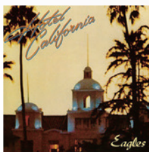
● 《Hotel California》