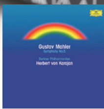
● 《马勒第五号交响曲》

流的状态都一一表达清晰。高潮部分，男声与吉他交相辉映，并展现出出色的分离度和现场感。