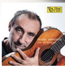
● 《Live At Alcatraz》